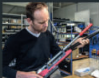
Christian Planer Rifle Fitting / Service, Reparaturen